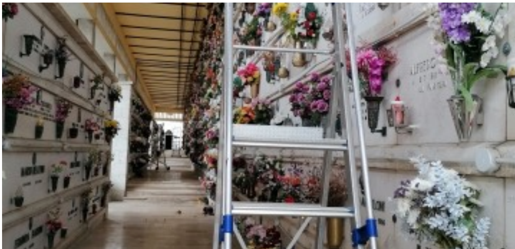
COLOMBARIO ZONA OVEST PARTE VECCHIA